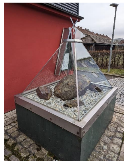
Foundling li Arzberg

Bajarê Arzberg navê bajarê xwe deyndarê depoyên hesin û kanzayên wan e. Bi demê re Erzberg û Artzberg bûne Arzberg.