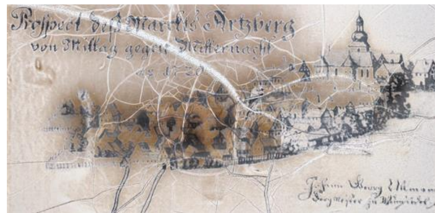
Wêneya Arzberg di dema Humboldt de

Di dema Alexander von Humboldt de, kanên herî bikêr ên Bayreuth Fürstenturm li Arzberg, ku aîdî Desthilata Madenê ya Wunsiedel bû, bûn. Li vir li dora 20 kanên madenê hesin di binê erdê de tê derxistin, hin ji wan ji Serdema Navîn ve. Di dema gera xwe ya çavdêriyê de di 1792 de, Humboldt bi taybetî bal kişand ser navçeya Arzberg.