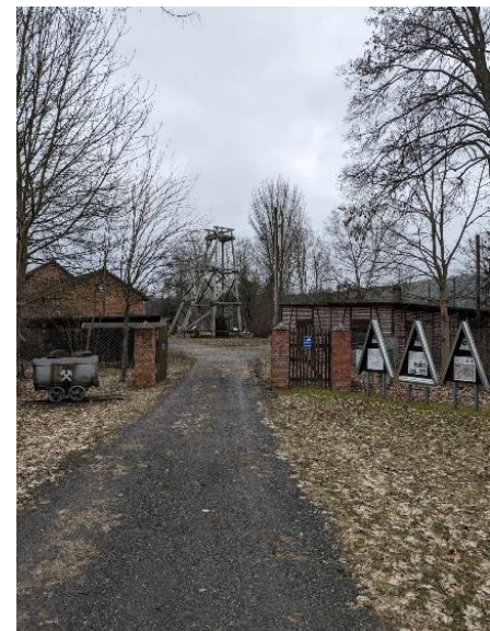
شکل: ورودی معدن "یوهانس کوچک".

برای بزرگداشت اقامت الكساندر فون هومبولت به عنوان استاد کوهستانی از سال 1792 تا 1796، مسیر پیاده روی دایره ای 6 ای ایجاد شد و به نام او نامگذاری شد. طول مسیر دایره ای 7 کیلومتر است و از سایت های معدنی مهم و زندگی هومبولت در آرزبرگ می گذرد.