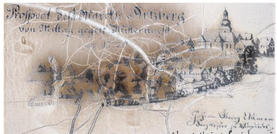
تصویر آرزبرگ در زمان هومبولت

در زمان الكساندر فون هومبولت، سودآورترین معادن در Bayreuth در Fürstentum در Arzberg قرار داشت که متعلق به اداره معدن Wunsiedel بود. سنگ آهن در حدود 20 معدن در زیر زمین استخراج شده است، برخی از آنها از قرون وسطی. هومبولت در طول سفر بازرسی خود در سال 1792 توجه خاصی به منطقه آرزبرگ داشت.