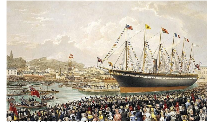
Рис.: Глобалізація в 19 ст

Олександр фон Гумбольдт був людиною, яка багато подорожувала. Окрім візитів до Європи та Африки, він також подорожував до Америки. Навіть тоді подорожі були важливою ознакою глобалізації (глобалізація = об'єднання всього світу). У 19 столітті багато німців емігрували до Америки, а торговці плавали на своїх кораблях по всьому світу. Але Олександр свого часу побив рекорд подорожей.