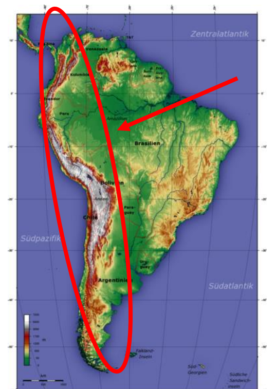
Мал.: Розташування Анд у Південній Америці

Географія рослин поєднує в собі розділи біології та географії. Біологія показує, що рослини пристосовані до певних факторів навколишнього середовища, наприклад дощ/суха/спека/холод. Щоб спостерігати рослини в різних умовах, Гумбольдт піднімався в Анди під час своїх подорожей. Вони мають максимальну висоту 6961 м. Під час підйому Гумбольдт майже пройшов пішки всі рівні висоти. Тим часом він спостерігав за собою Рослинність, тобто ріст і тип рослин, змінюється з висотою.