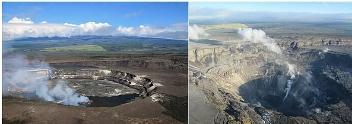
Hêjîr: Kaldera volqanekê

Dema ku Humboldt diçû Almanyayê, li ser volkanên Okyanûsa Pasîfîkê digeriya û yek ji wan ji nişka ve teqiya. Wî ev serpehatî