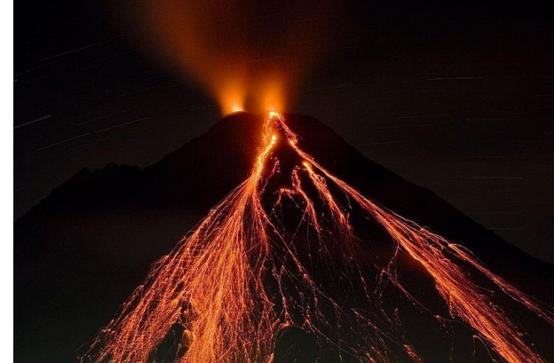
Hêjîr: volqan diteq