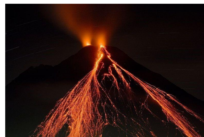
Мал.: виверження вулкана