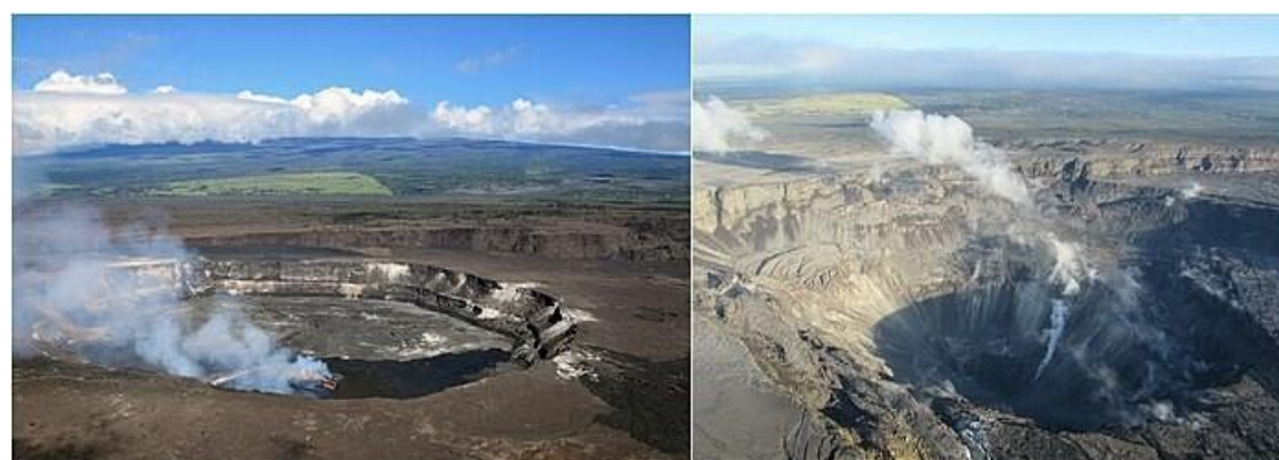
Мал.: Кальдера вулкана