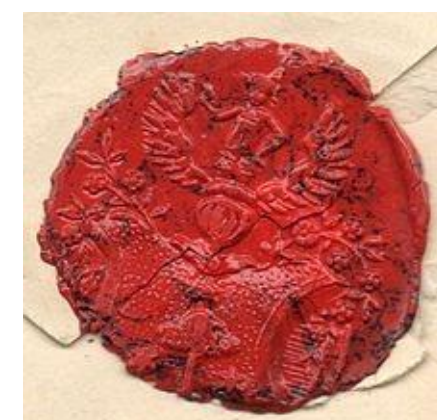
Мал.: Печатка Гумбольдта

У мережі були представлені гуманітарні науки та культурологія, анатомія, фізіологія, ботаніка, природничі науки, астрономія та математика. Сам Олександр виступав за природознавство, астрономію та картографію. Він був альпіністом і розвідником, який мандрував світом і хотів відкрити для себе природні чудеса світу.