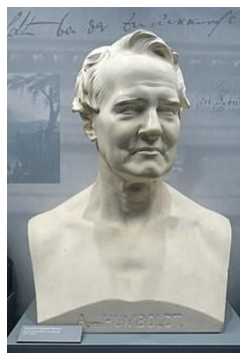
Wêne: Bust of Humboldt

Humboldt di warên fîzîk, erdnasî, mînerolojî, botanîk, erdnîgariya nebatan, zoolojî, klîmolojî, okyanûs û astronomiyê de lêkolînên qada zanistî pêk anî. Lêkolînên din li ser erdnîgariya aborî, etnolojî, demografî, fîzolojî û kîmyayê bûn. Wî bi gelek pisporên ji dîsîplînên cûrbecûr re ramanan danûstendin û bi vî rengî torgilokek zanistî çêkir.