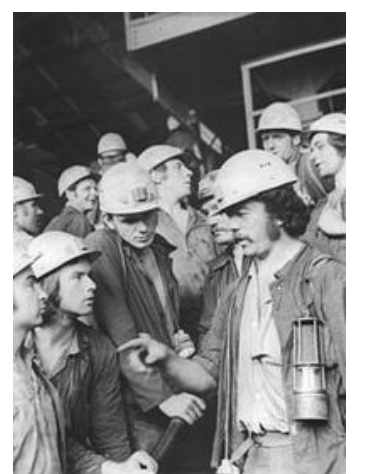
Wêne: Miner li Guhertina veguherînê

Car bi car dibû ku kaniya binê erdê di bin avê de ma. Dema ku karkerên madenê bi ava binê erdê re rû bi rû diman ev yek diqewime. Îskender jî karîbû vê pirsgirêkê çareser bike. Wî çerxeke mezin a avê dîzayn kir û ew bi cûreyek boriya avê ve girêda. Bi zivirîna çerxa avê av ji tunelan (wek îro bi pompê) dihat derxistin û xebat didomin.