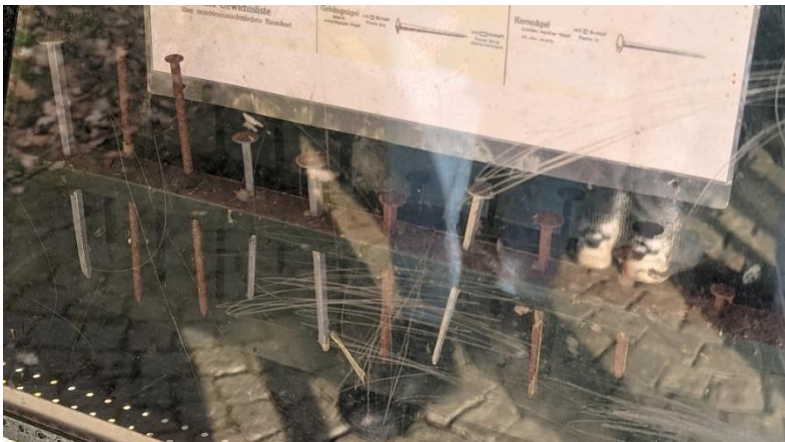
Рис. Гвоздезабивной станок за стеклом на Гумбольдтвее