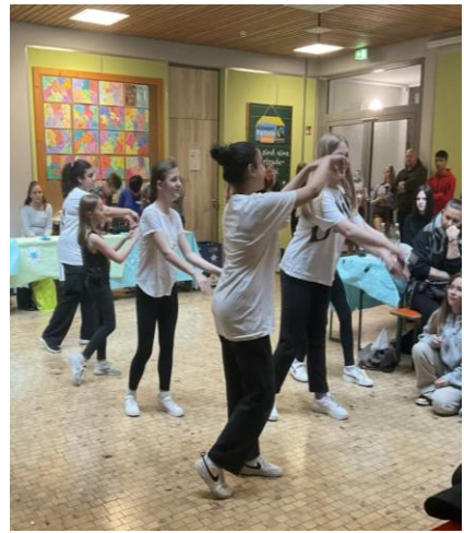
Tanzgruppe 5 Jahrgangsstufe