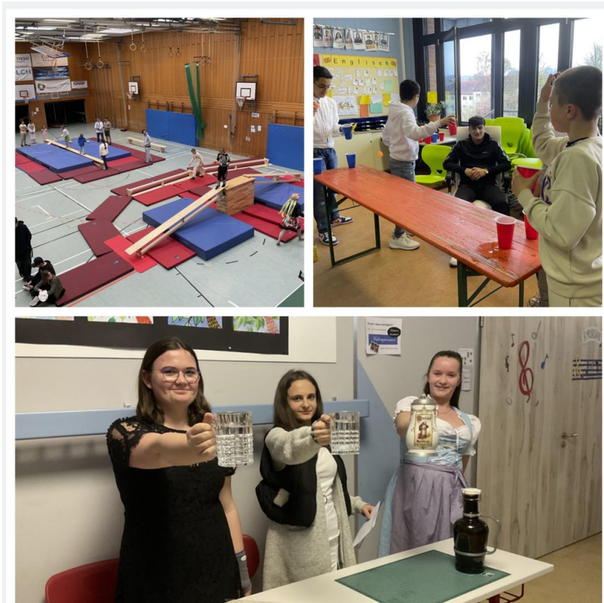
Spieleangebot: Bavarian Gladiators, WasserPong, Maßkrugstemmen