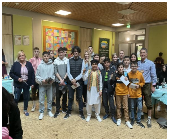
Die Gewinner der Preisverleihung

Traditionelle Kleidung der Schülerinnen und Schüler