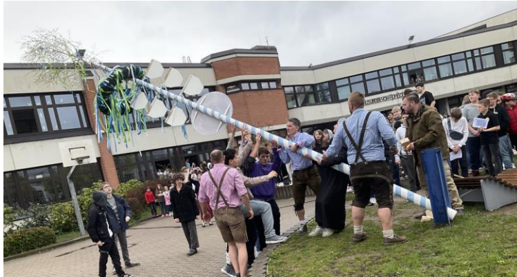
Aufstellung des Maibaums