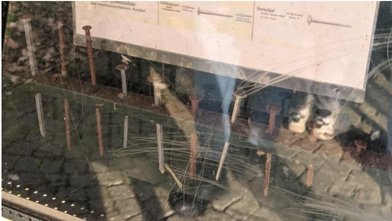
Şekil: Arzberg'deki Humboldtweg'de camın arkasındaki çivi makinesi

Demir işlemeye ilgili en önemli zanaatlardan biri çivi ustalığıydı. Künzel ailesi bu zanaatı Arzberg'de icra ediyordu. Erhard Künzel eğitimli bir Elsen satıcısıydı ve 1905 yılında Almanya'nın ilk çivileme makinesini yaptırmıştı. Bunun dakikada maksimum 50 çivi üretim kapasitesi vardı. Günümüzde modern bir çivi makinesinin performansı dakikada 3.500 çividir.