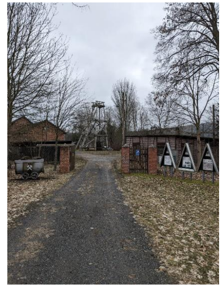
Şekil: "Küçük Johannes" madeninin girişi

Alexander-von-Humboldt'un 1792'den 1796'ya kadar baş dağ ustası olarak kalışını anmak için, dairesel yürüyüş yolu 6 oluşturuldu ve onun adını aldı. Dairesel rota 7 km uzunluğunda olup önemli maden sahalarının ve Humboldt'un Arzberg'deki yaşamının önünden geçmektedir.