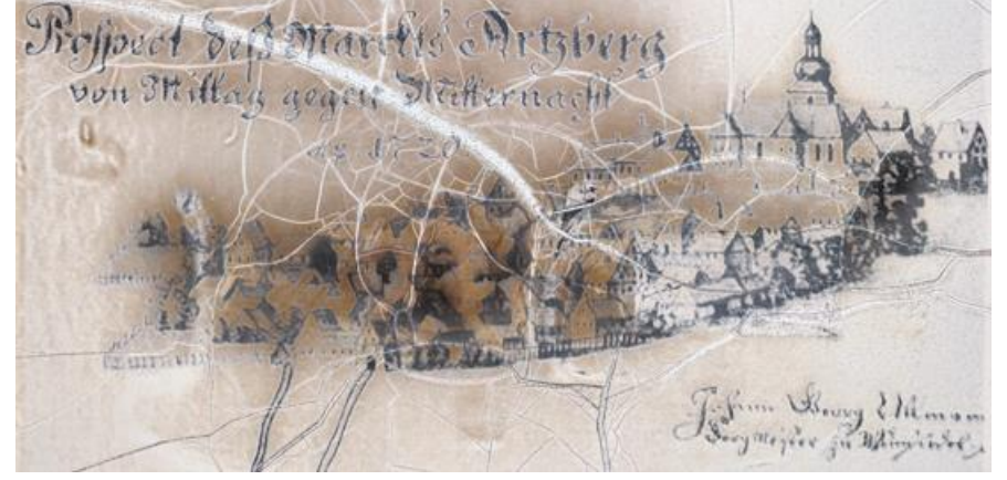
Şekil: Arzberg'in Humboldt zamanındaki çizimi

Alexander von Humboldt'un zamanında Bayreuth Fürstenturm'daki en karlı madenler Wunsiedel Madencilik Otoritesi'ne ait olan Arzberg'de bulunuyordu. Burada, bazıları Orta Çağ'dan beri olmak üzere yaklaşık 20 madende yer altında demir cevheri çıkarılıyor. Humboldt, 1792'deki teftiş gezisi sırasında Arzberg bölgesine özellikle dikkat etti.