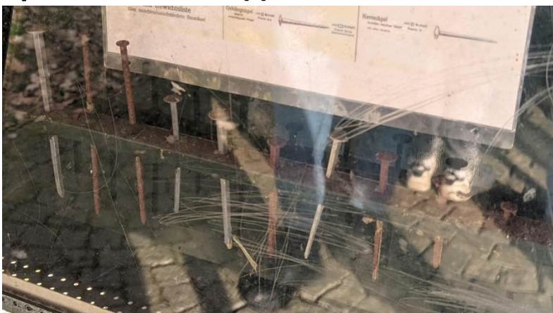
Рис. Цвяховий верстат за склом на Humboldtweg в Arzberg

Одним із найважливіших ремесел щодо обробки заліза було ремесло цвяхів. Сім'я Кюнцель займалася цим ремеслом в Арцберзі. Ерхард Кюнцель був навченим дилером Elsen і створив першу в Німеччині цвяхову машину в 1905 році. Він мав виробничу потужність максимум 50 цвяхів на хвилину. Продуктивність сучасної цвяхової машини сьогодні становить 3500 цвяхів за хвилину.