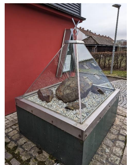
Мал. Підкидьок в Арцберзі

Своєю назвою місто Арцберг зобов'язане своїм родовищам залізної руди та їх видобутку. З часом Erzberg і Artzberg стали Arzberg.