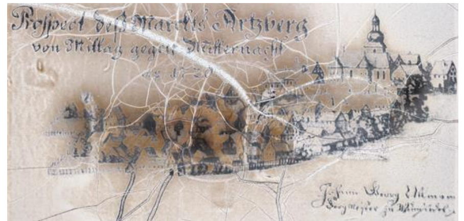
Рис. Ілюстрація Арцберга за часів Гумбольдта

За часів Олександра фон Гумбольдта найприбутковіші шахти Bayreuth Fürstenturm були розташовані в Арцберзі, який належав Гірничому управлінню Wunsiedel. Залізну руду тут видобували під землею приблизно в 20 шахтах, деякі з них ще з Середньовіччя. Під час своєї інспекційної поїздки в 1792 році Гумбольдт звернув особливу увагу на округ Арцберг.