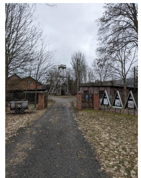
Рис.: Вхід до шахти «Малий Йоганнес».

На честь перебування Олександра-фон-Гумбольдта як головного гірського майстра з 1792 по 1796 рік було створено кругову пішохідну стежку 6, яку названо на його честь. Кільцевий маршрут протяжністю 7 км пролягає повз важливі місця видобутку корисних копалин і життя Гумбольдта в Арцберзі.